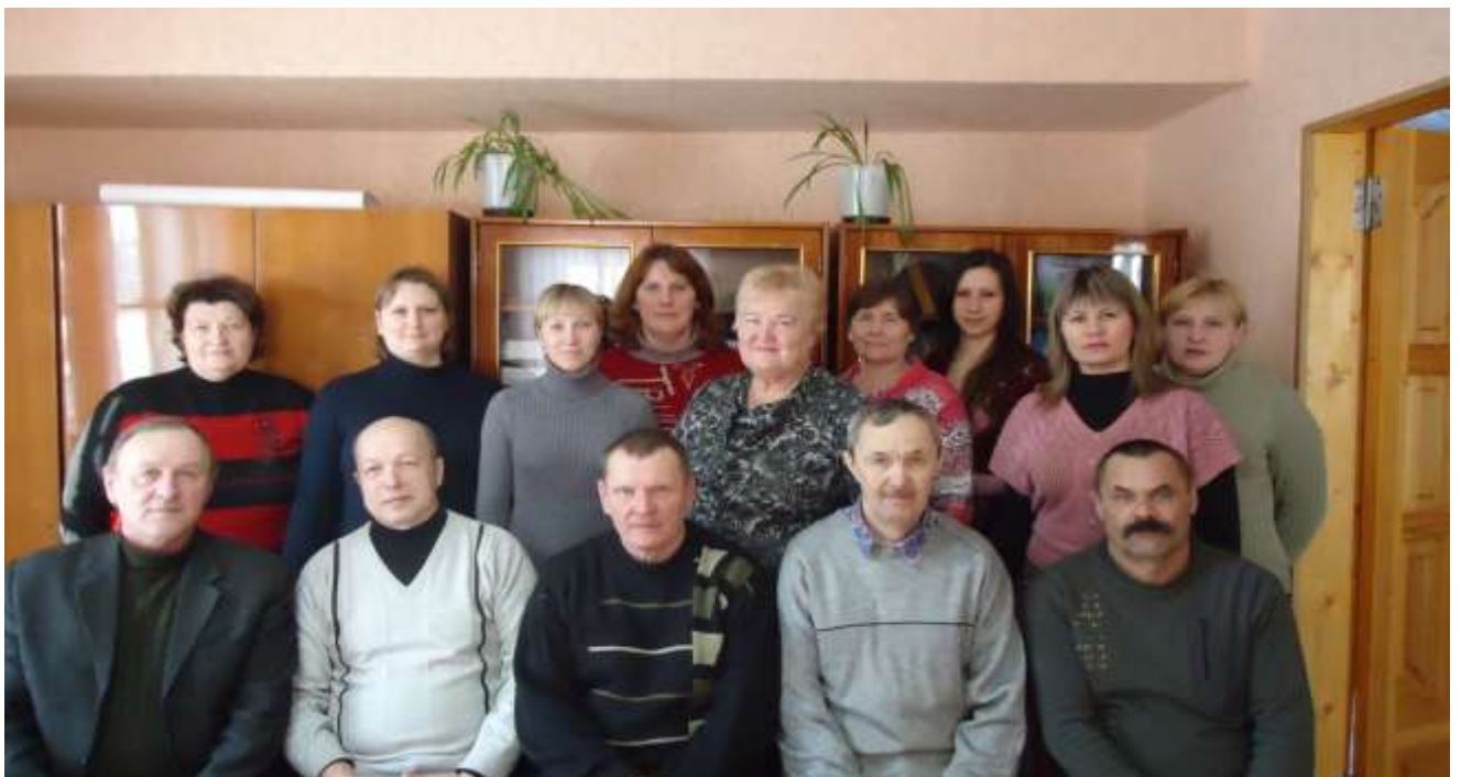
КОЛЛЕКТИВ КОГКУ «Пижанская рай СББЖ» 2015 год