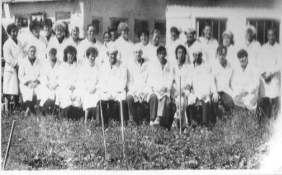
Коллектив вет. службы района перед проведением конкурса - аттестации специа- листов п-з „Ленинец“.