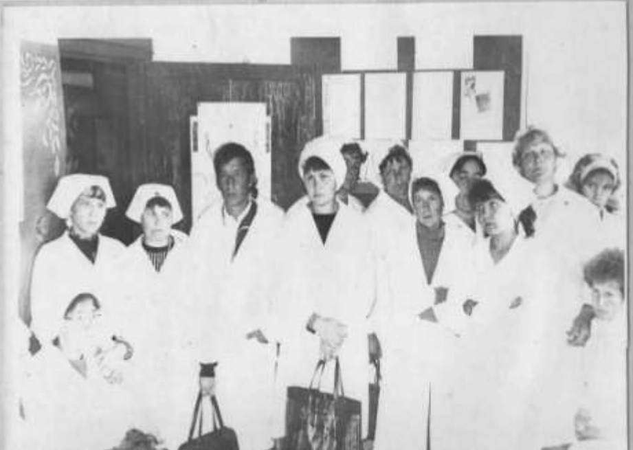
Ознакомление с условиями проведения конкурса - аттестации