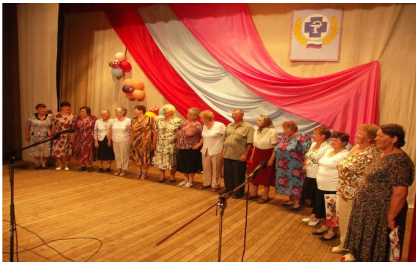
Ветераны ветеринарной службы Пижанского района в День ветеринарной медицины и 105 — ление ветеринарной службы района 2012 год