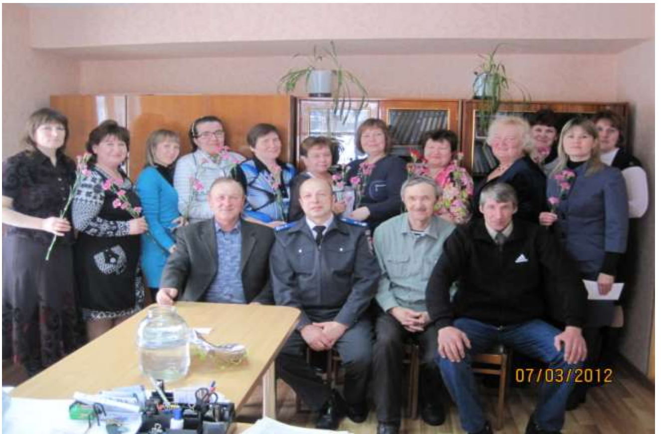
Коллектив КОГКУ «Пижанская рай СББЖ» 2012 год