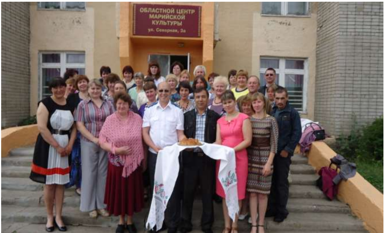
Ветеринарная служба района в День ветеринарной медицины д. М -Ошаево 2014 год