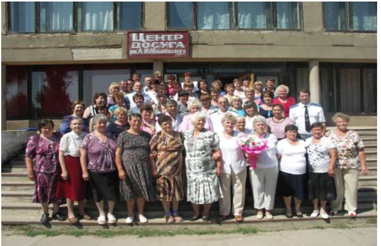
Ветеринарная служба Пижанского района и ветераны в 105 -летний юбилей 2012 год