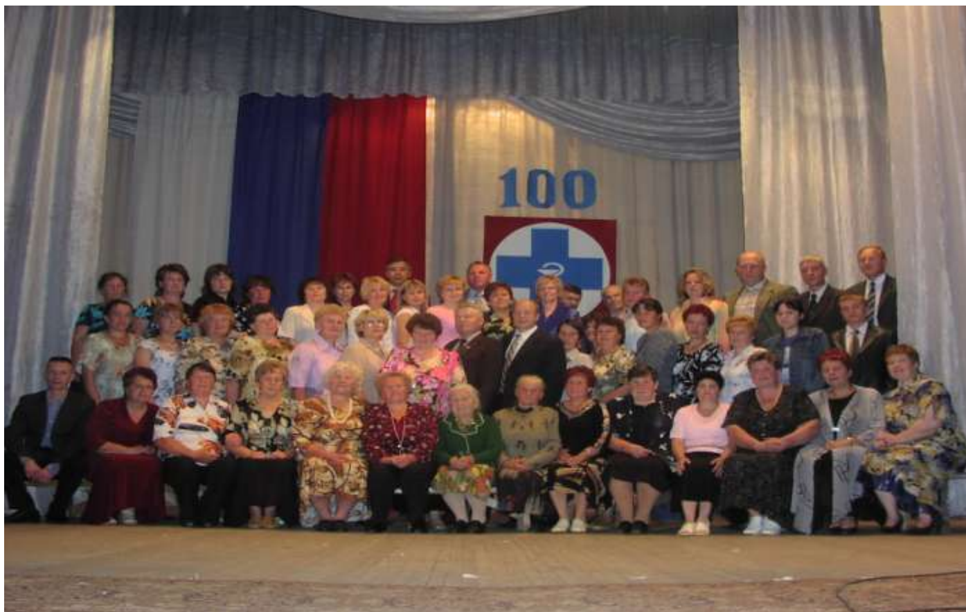
100-ЛЕТИЕ ВЕТЕРИНАРНОЙ СЛУЖБЫ ПИЖАНСКОГО РАЙОНА 2007 ГОД